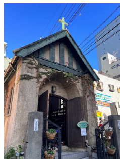
12月17日 大宮聖愛教会