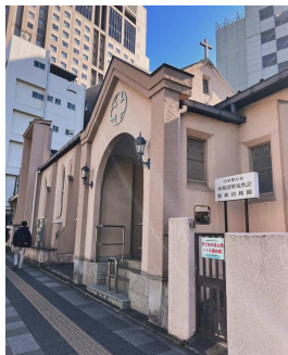
12月3日 浦和諸聖徒教会

浦和諸聖徒教会、大宮聖愛教会に教会訪問に行ってきました！初めての北関東です。これからはカパティランの活動をご紹介させていただくため、都内近郊の教会に少しずつ回っていきこうと計画しています。